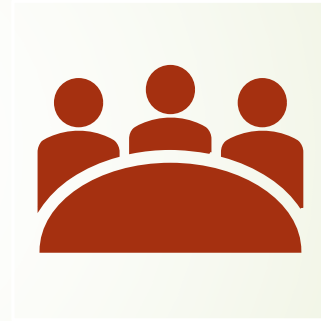
İşletme Bölümü Staj Komisyon Başkanı