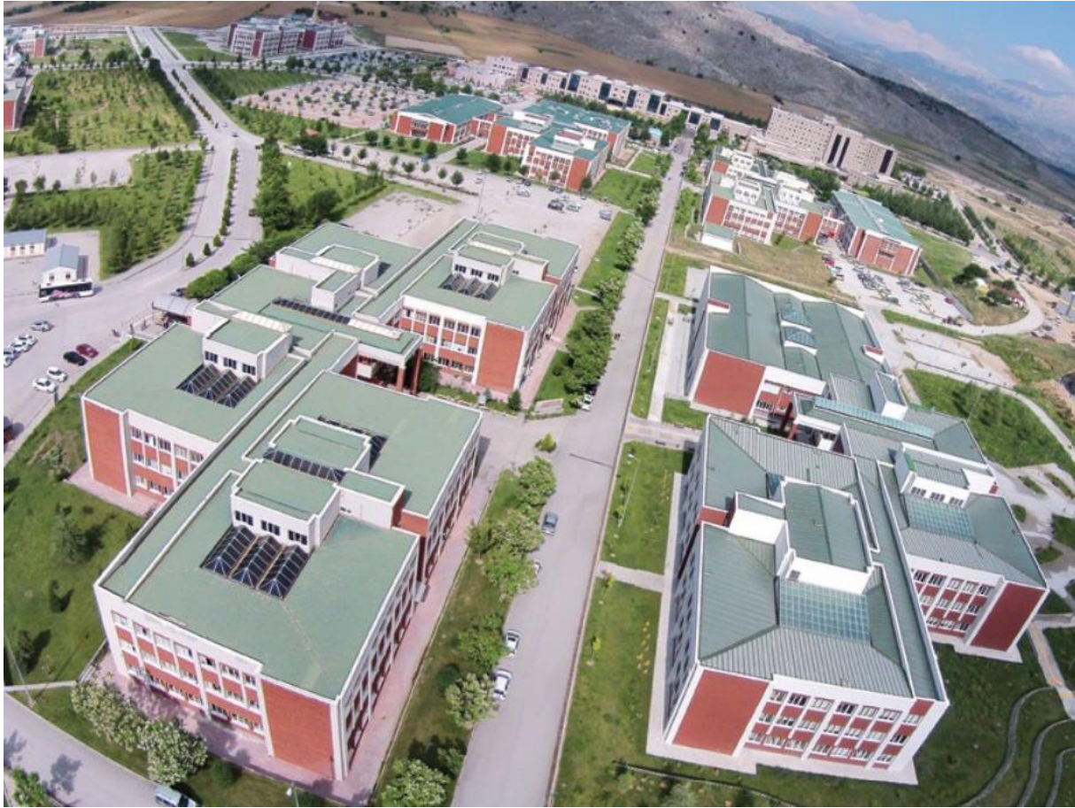
Fotoğraf 1. SDÜ İİBF'nin 2001 – 2016 Tarihleri Arasında Kullandığı Binası

2016 yılı itibariyle yine Doğu Yerleşkesinde bulunan yeni binasına taşınan İİBF, 2023 – 2024 itibariyle de bu yeni fakülte binasında bulunmaktadır 19 .