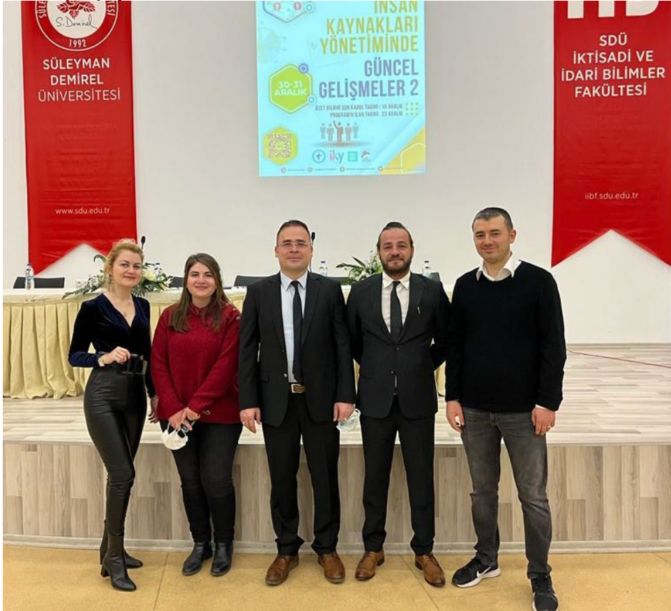
Resim 23. Çalıştay Görself 3

Çalıştay boyunca katılımcıların hatıra fotoğrafları renkli anlara sahne olmuştur.