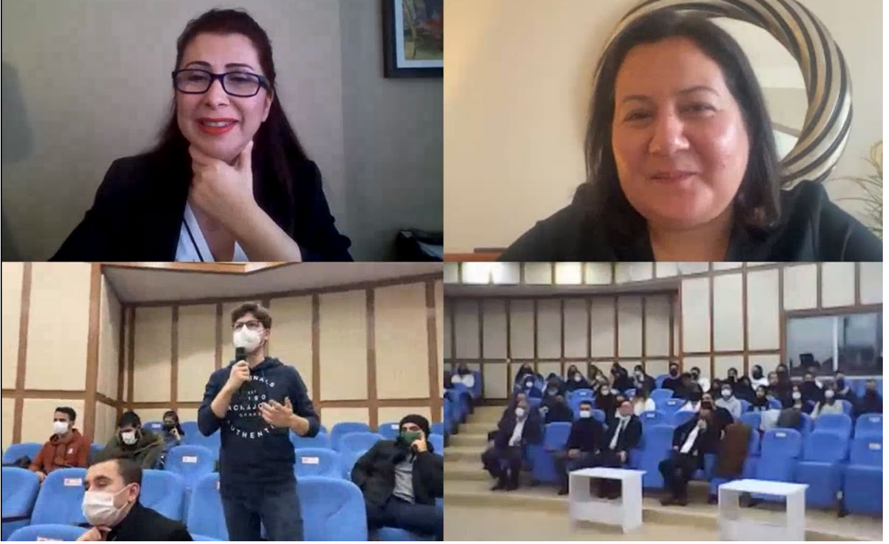
Resim 7. Açılış Oturumu Görself 6