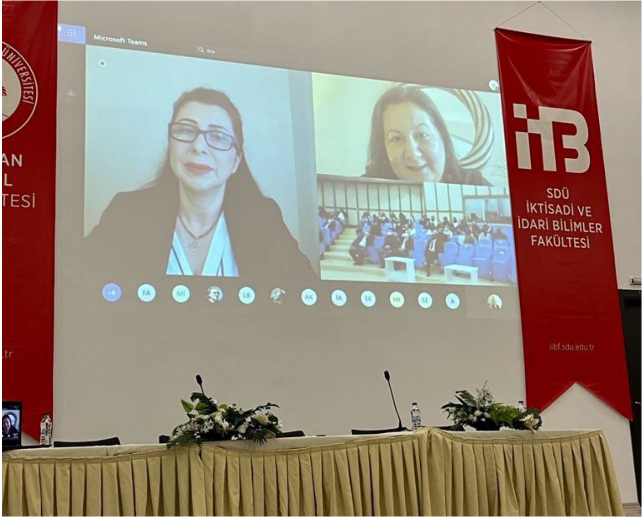
Resim 11. Açılış Oturumu Görseli 9