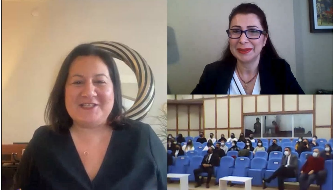
Resim 3. Açılış Oturumu Görseli 2