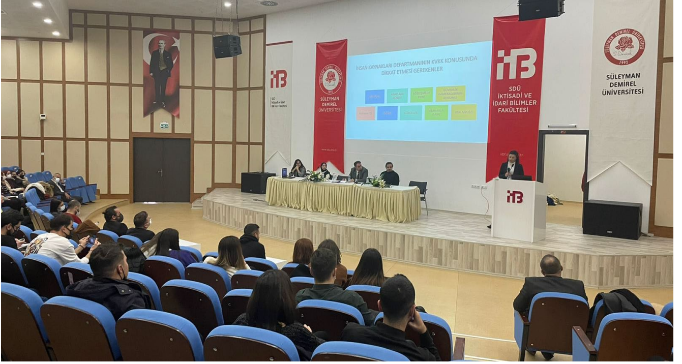
Resim 19. Oturum Görselleri 8