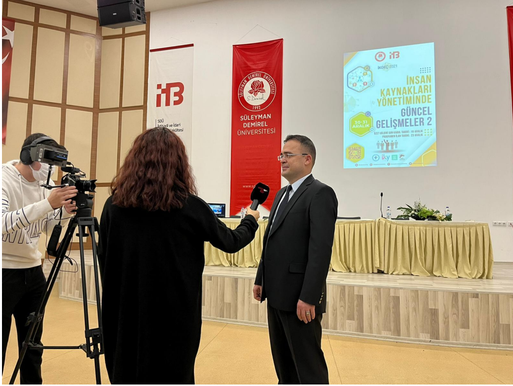
Resim 22. Çalıştay Görself 2

Çalıştay boyunca katılımcıların hatıra fotoğrafları renkli anlara sahne olmuştur.