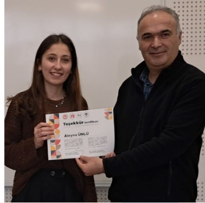
Resim 34. Organizasyon Ekibi Katkı Belgesi Takdimi Görseli 2