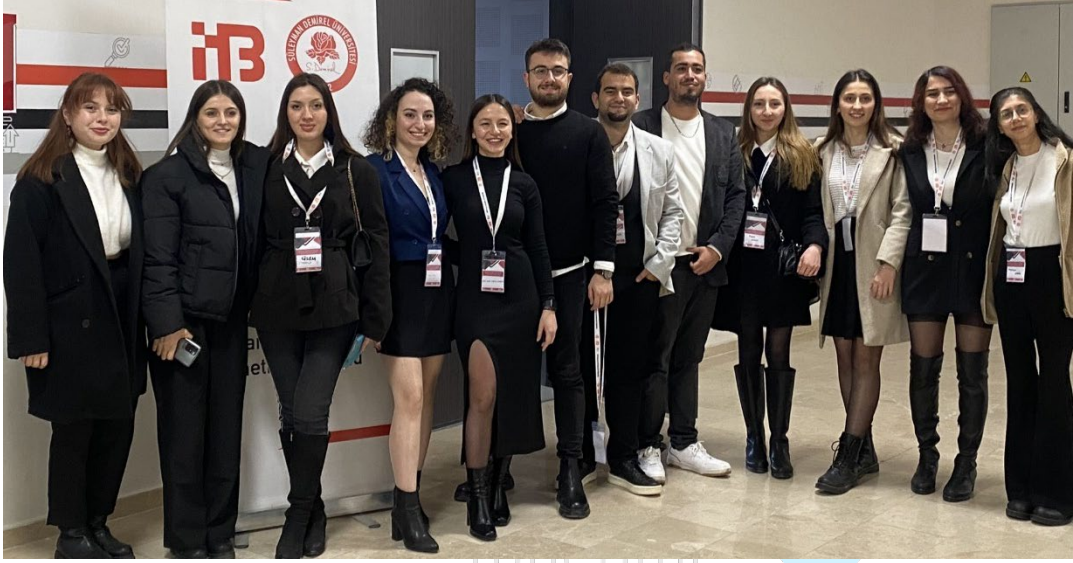
Resim 29. Organizasyon Ekibi Görseli 1

İKGEÇ Lisans 4 organizasyon ekibinin organizasyon boyunca çeşitli anlarda kaydettiği görseller aşağıya eklenmiştir.