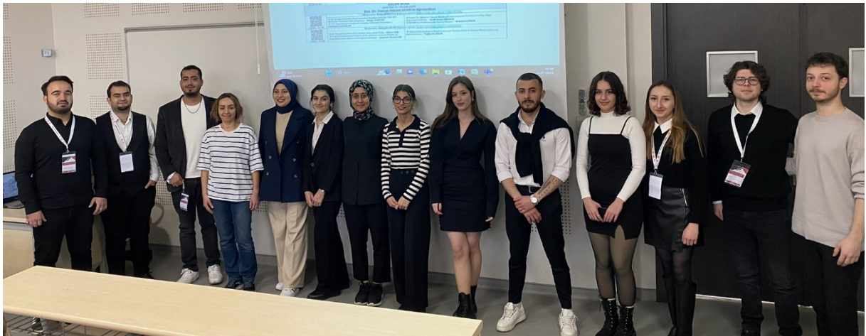
Resim 2. Oturum Görseli 1

Çalıştay oturumlarında medya görevlileri tarafından kayda alınan görsellerden bazıları aşağıya eklenmiştir.