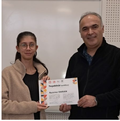
Resim 33. Organizasyon Ekibi Katkı Belgesi Takdimi Görseli 1