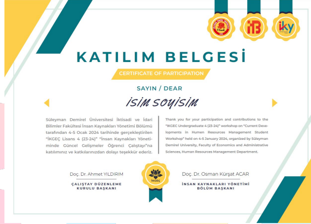
Resim 28. Katılım Belgesi Örneği

İKGEÇ Lisans 4'te sunum yapan öğrencilere elektronik olarak isimlerine özel hazırlanan katılım belgeleri organizasyondan sonraki bir ay içinde, çalışmaya kaydolurken belirttikleri e-posta adreslerine gönderilmiştir. Gönderilen katılım belgesine dair örnek görsel aşağıya eklenmiştir.