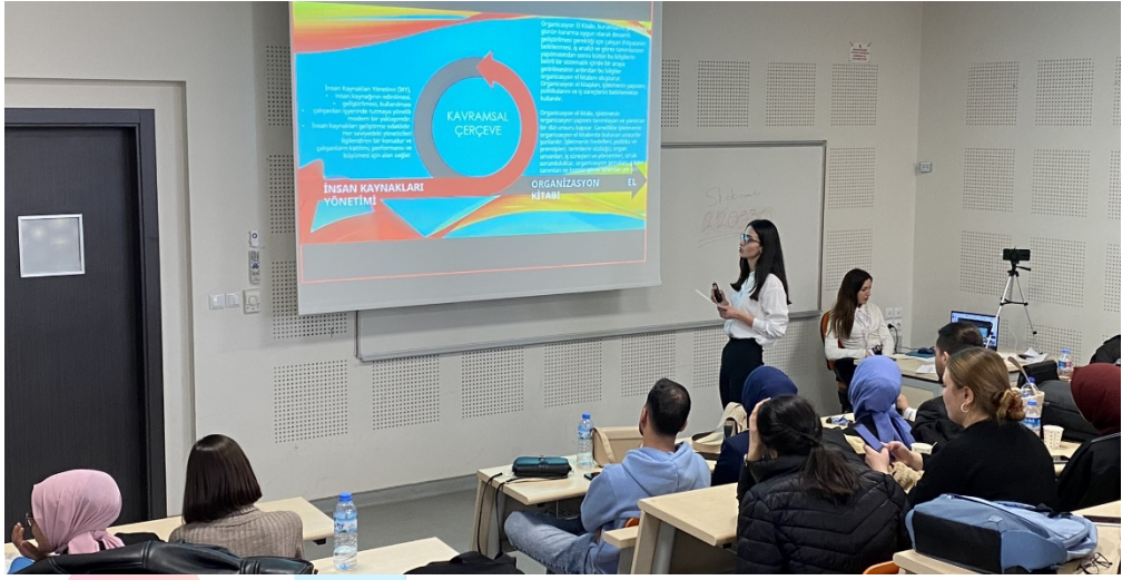
Resim 11. Oturum Görseli 10