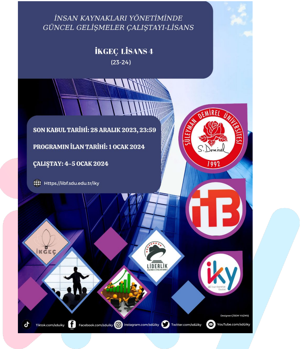
Resim 1. İKGEÇ Lisans 4 İçin Kullanılan Duyuru Afışı